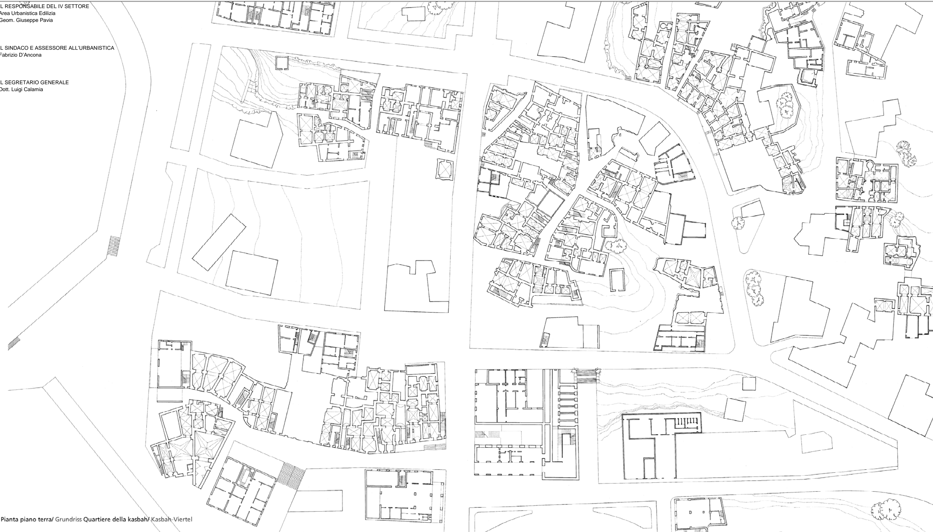
Pianta piano terra/ Grundriss Quartiere della kasbah/ Kasbah-Viertel